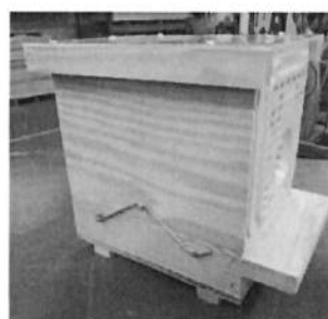
Piège nasse à grilles Néoppl jaunes