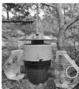
Piège coréen à ailes