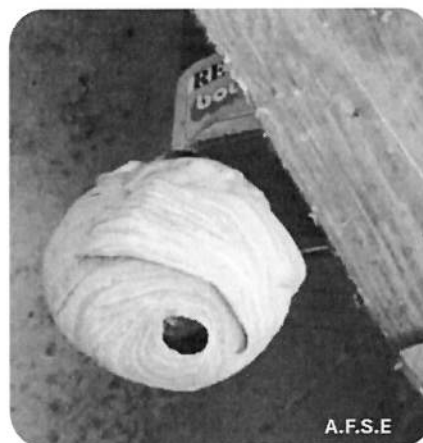
Exemples de nids primaires de frelons à pattes jaunes